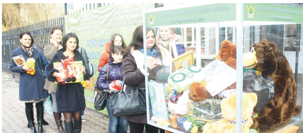
Преподаватели и студенты Северо-Кавказского федерального университета участвуют в акции «Все вместе-детям».