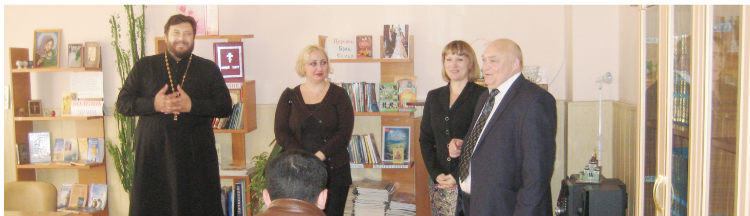
Открытие курсов по изучению русского языка в Спасо-Преображенском соборе г. Изобильного.

В связи с введением с 1 января 2015 года обязательного экзамена по русскому языку, истории России и основам законодательства РФ для иностранных граждан, желающих оформить разрешение на работу, патент, разрешение на временное проживание, вид на жительство, УФМС России по Ставропольскому краю проводит совместную с религиозными конфессиями работу по открытию бесплатных курсов, которые помогут мигрантам повысить уровень владения русским языком.