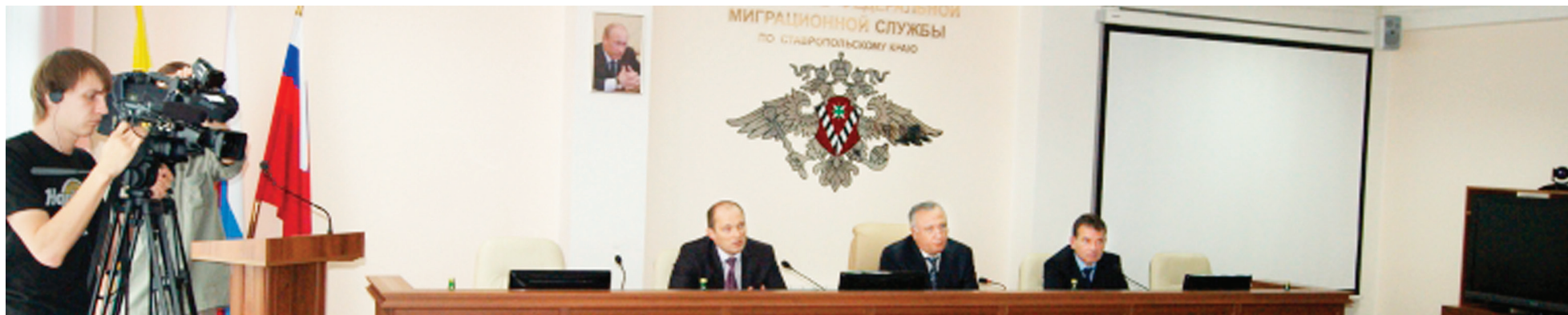
Брифинг, посвященный ходу реализации госпрограммы переселения соотечественников из-за рубежа.

23 сентября 2014 г. Постановлением Правительства Ставропольского края №382-п утверждена подпрограмма «Оказание содействия добровольному переселению в Ставропольский край соотечественников, проживающих за рубежом» государственной программы Ставропольского края «Социальная поддержка граждан».