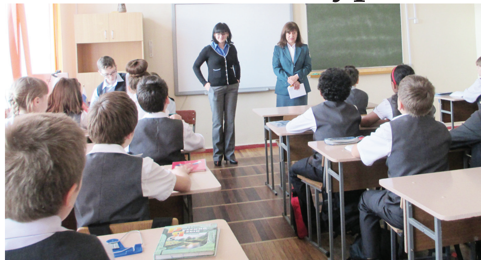
Для учеников средних классов уроки налоговой грамотности проводятся в игровой форме.

Ставропольские школьники попробовали перевоплотиться в законодателей и налогоплательщиков. В четырнадцать школах края прошли уроки налоговой грамотности, в них приняли участие более пятисот учеников. Акция проводится налоговыми органами страны ежегодно с целью формирования финансовой грамотности детей и подростков. Немаловажно и то, что подобные мероприятия позволяют заложить основы гражданской ответственности юных членов общества.