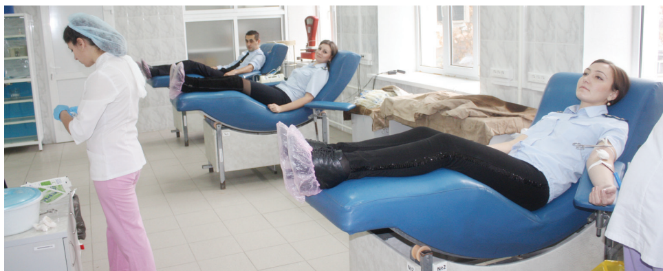
Судебные приставы ставропольских городских отделов сдают кровь.