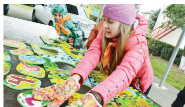
Каждый раз ребята из «Надежды» поражают своих шефов новыми идеями, талантами и костюмами.