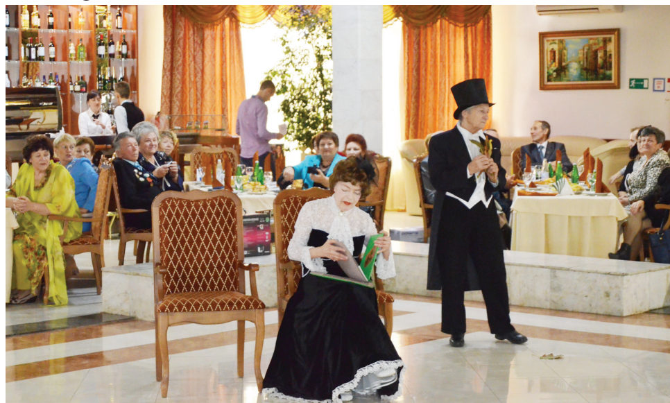
В творческом вечере приняли участие талантливые ставропольцы: певцы, танцоры, поэты и мастера прикладного творчества.