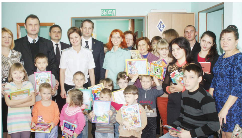
Руководство Управления судебных приставов, члены Общественного совета, студенты молодежного движения «Перспектива» и воспитанники приюта «Росинка».