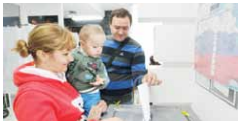
Наблюдатели находились на избирательных участках на протяжении всего времени голосования и присутствовали при подведении итогов.

Порядка 200 молодых юристов, активистов молодежного крыла Ставропольского регионального отделения Ассоциации юристов России, стали наблюдателями Корпуса «За чистые выборы» 14 сентября на досрочных выборах Губернатора Ставропольского края.