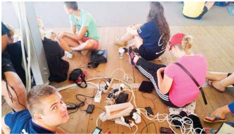
Специальное устройство для зарядки электронных гаджетов не справлялось с четырьмя тысячами желающих.

парни востребованные. Каждый день мы назначали дежурных, которые следили за порядком в лагере, поддерживали костер, грели воду для чая, ходили за водой, едой и за дровами, следили, чтобы еда всем досталась. У дежурных была привилегия не ходить на пары, правда, занятия были настолько интересными, что стремления отлынивать не было ни у кого.