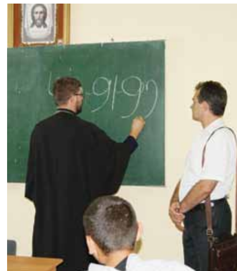
С начала открытия проекта обучение прошли около 450 иностранных граждан.

Проходить обучение на курсах изъявили желание более 20 человек: граждане Узбекистана, Армении, Таджикистана, Мальты и Греции. Курсы дадут им возможность повысить уровень грамотности с целью последующей сдачи обязательного с 1 января 2015 года экзамена по русскому языку, истории России и основам законодательства Российской Федерации для иностранных граждан, желаю-