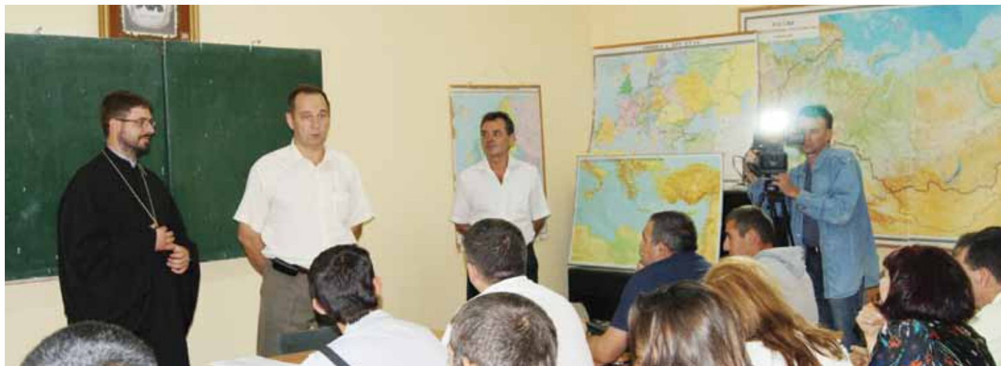
С начала открытия проекта обучение прошли около 450 иностранных граждан.