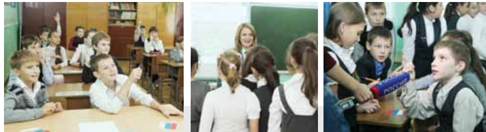
На уроке налоговой грамотности школьники вполне успешно справились с законодательными инициативами.

В лицее № 23 города Ставрополя 23 сентября прошел урок налоговой грамотности. В качестве учителей попробовали свои силы налоговые инспекторы. Ученики 5а класса с азартом примеряли на себя роли законодателей, налогоплательщиков и общественности. Оказывается, школьники в столь юном возрасте уже вполне осознанно могут выразить свою позицию по поводу введения новых налогов и аргументировать правильность или неправильность таких решений.