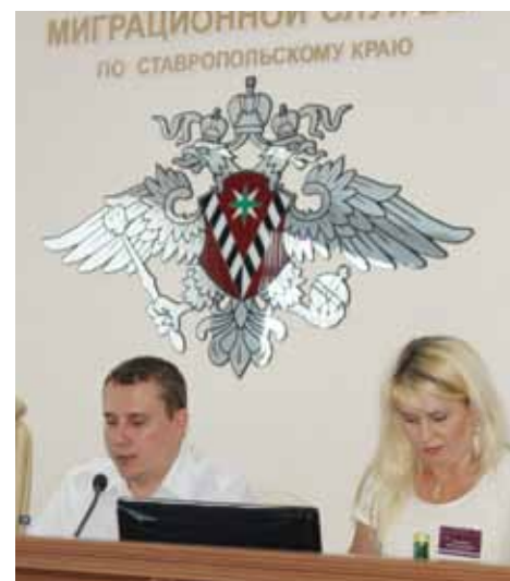
Разъяснен порядок осуществления иностранными студентами трудовой деятельности.

По итогам работы Комиссии единогласно признаны носителями русского языка 19 граждан Украины, 3 гражданина Казахстана, 1 гражданин Армении, 1 гражданин Азербайджана.