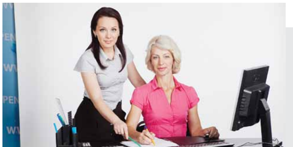
За четыре года проведения конкурса награды получили около пяти тысяч наиболее социально ответственных работодателей.

Пенсионный Фонд Российской Федерации объявляет о начале пятого ежегодного Всероссийского конкурса «Лучший страхователь года по обязательному пенсионному страхованию – 2014».