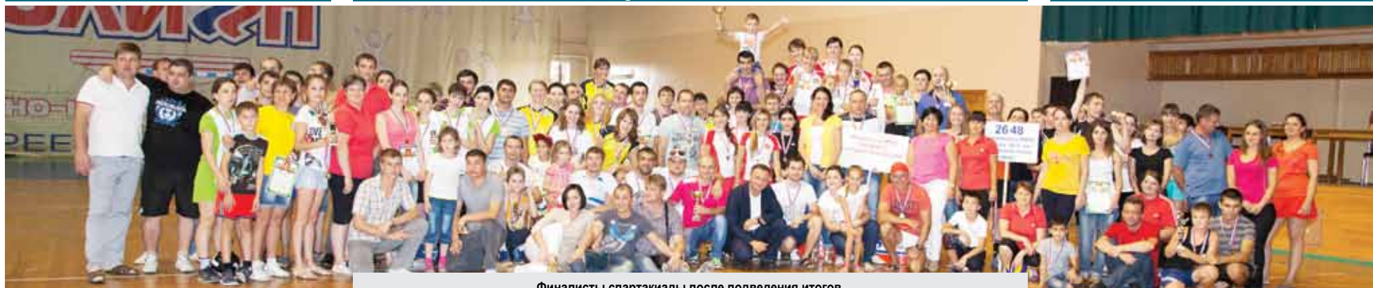
Финалисты спартакиады после подведения итогов.