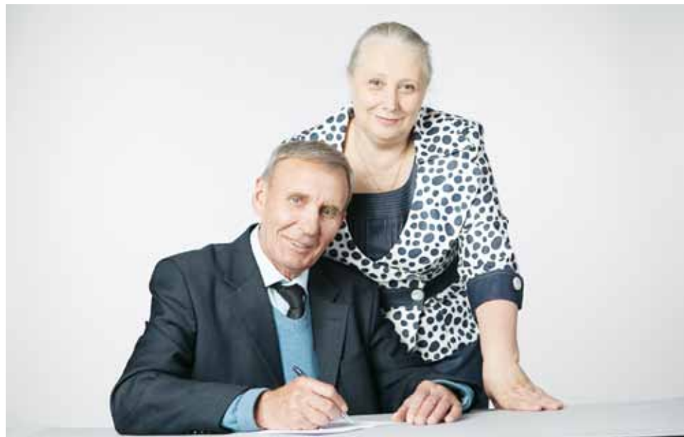
Пенсионные права, сформированные до 2015 года, преобразуются в баллы и сохраняются в полном объеме.

Со следующего года в России вводится новая формула расчета пенсии. Вместо трудовых пенсий будут назначаться страховые пенсии (по старости, по инвалидности и по случаю потери кормильца) и накопительная пенсия (если человек определится, что будет формировать собственные пенсионные накопления).