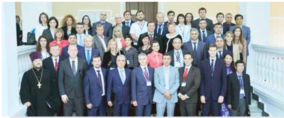
Главной задачей международного сотрудничества в сфере розыска должников и их активов является создание единого правового пространства.