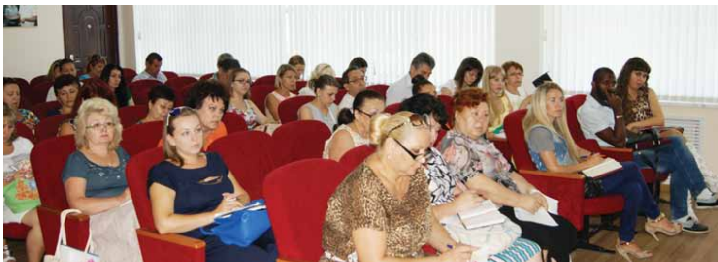
В УФМС России по Ставропольскому краю состоялся семинар-совещание с представителями образовательных организаций