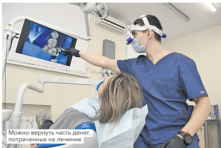
Можно вернуть часть денег, потраченных на лечение

Если вы не получали доход, с которого уплачивался налог на доходы с физических лиц по ставке 13 процентов в бюджет, но при этом понесли расходы на приобретение жилья, основания для предоставления налоговых вычетов и возврата суммы НДФЛ из бюджета отсутствуют. В связи с этим предоставление имущественного налогового вычета одновременно на всю сумму понесенных на приобретение объекта собственности расходов не предусмотрено.