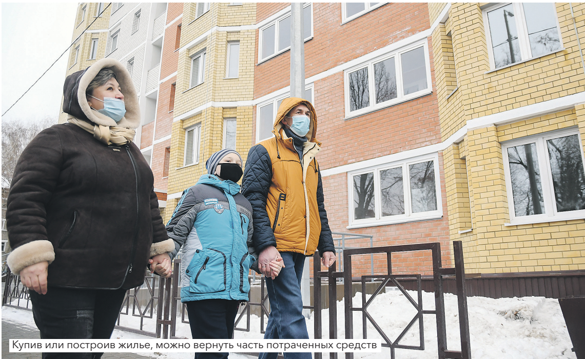
Купив или построив жилье, можно вернуть часть потраченных средств

НЕДАВНО СРЕДИ ЛИПЧАН ПРОВЕЛИ СОЦПРОС ПО ФИНАНСОВОЙ ГРАМОТНОСТИ. КАК ОКАЗАЛОСЬ, ОДИН ИЗ НАИБОЛЕЕ ВОЛНУЮЩИХ ЖИТЕЛЕЙ РЕГИОНА ВОПРОСОВ — ЭТО «КАК И ЗА ЧТО МОЖНО ОФОРМИТЬ НАЛОГОВЫЙ ВЫЧЕТ?».